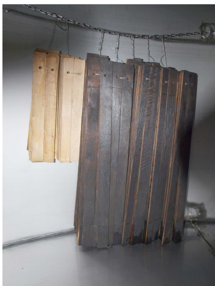
Barrel Head y duelas Stavin

Recomendamos disponer las duelas en el tanque de acero inoxidable mediante el sistema FAN. (Figura)